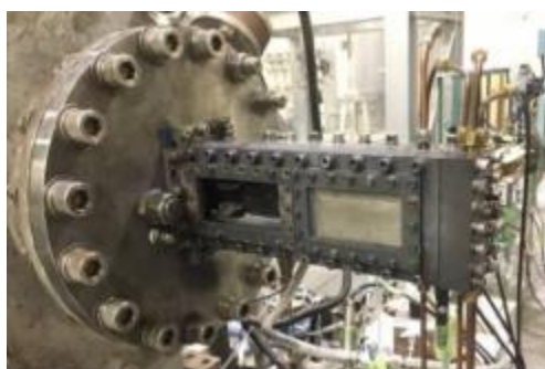
図 1 PCTJ アフターバーナ模擬燃焼器外観

図1に燃焼試験で使用した実験装置の外観を示す。ハイスピードカメラによる光学計測と圧力計を用いて、燃焼挙動を調査した。ハイスピードカメラには近赤外フィルタを取り付けてあり、水分子の近赤外発光を捉えたほか、OH発光の撮影を行った。図 2に当量比時間履歴, 圧力履歴と近赤外発光画像に対するDMDスペクトログラムを示す。当量比の増加に伴って熱音響振動が発生していることが分かる。図は割愛するが、当量比を下げた試験での結果から熱音響不安定性のヒステリシスが確認された。今後も燃焼試験を実施し、PCTJアフターバーナの燃焼特性をより詳細に解明することを目指す。